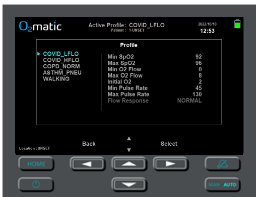
Figure 2 - Customize profile