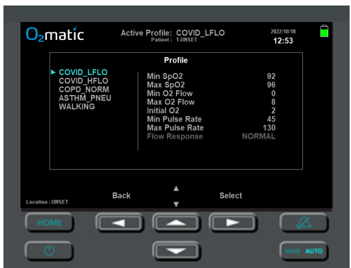
Figure 2 - Customize profile